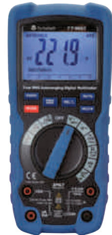
TT9663 & TT9664