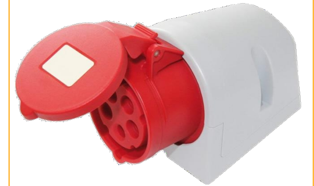
Prise de courant CEE 3P+N+E 6h 415 volts 32 ampères.

L'adaptateur se connecte aux prises de courant CEE 3P+N+E 6h 415 volts 32 ampères pour offrir des connexions femelles banane de 4 mm pour les 3 phases, le neutre et les conducteurs PE des prises de courant.