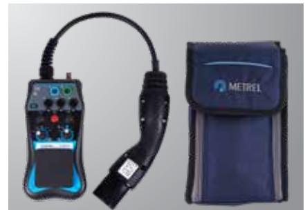
Abbeelding van een 1532 XA-set

Let op! De foto's in deze catalogus kunnen enigszins afwijken van de instrumenten op het moment van levering. Technische wijzigingen zijn zonder voorafgaande kennisgeving voorbehouden.