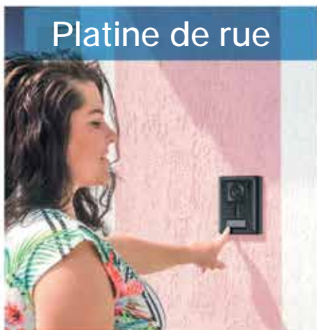
Platine de rue