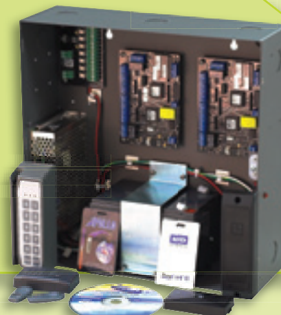
Série Apollo E2